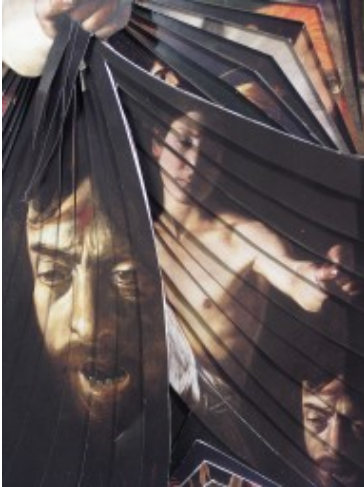
Liberintro - Caravaggio