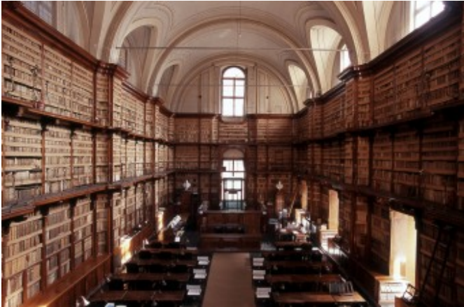
Salone Vanvitelliano- Biblioteca Angelica

La Biblioteca Angelica, nel cuore di Roma, è davvero un luogo dell'anima, oltre ad essere un'importante Biblioteca dal grande valore storico e culturale. Al suo interno, infatti, si trovano più di 200.000 volumi, di cui più di 100.000 editi dal XV al XVIII secolo. Un grandissimo patrimonio che va dalla letteratura alla scienza, dall'esoterismo alla religione. Inoltre libri di viaggio, carte geografiche, libri di medicina. La Biblioteca è anche una location molto affascinante per concerti, presentazioni di libri ed è stata anche lo scenario d'importanti film cult che costituiscono la storia del cinema, dal "Giardino dei Finzi Contini" di Vittorio de Sica al più recente "Angeli e Demoni" di Ron Howard. Nella Galleria sottostante sono ospitate mostre d'arte. In corso ancora la mostra "Liberintro d'Arte" dello scultore Claudio Perri , lo scultore che scolpisce libri. Nell'ambito della sua mostra Perri, ieri pomeriggio, ha voluto donare ai propri ospiti un delicatissimo concerto di chitarra, che ha avuto la capacità di fermare il tempo per qualche ora,