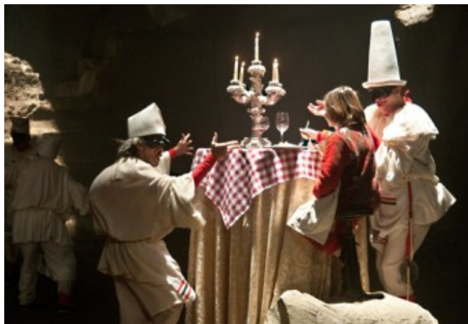
The Wholly Family di Terry Gilliam.

Gilliam si dedica alla maschera emblematica di una città che sorge a poca distanza dalla più concreta e plastica rappresentazione dell'Inferno, in una prospettiva per nulla scontata né bozzettistica, in base al suo stile che ricalca quello dei maestri – non a caso italiani – cui ha spesso ammesso di ispirarsi, da Pasolini a Fellini . Non sarà certo il regista anglosassone l'uomo in grado di decifrare il mistero scoperto di Napoli, l'indagatore felice dei suoi segreti. Con intelligenza e sensibilità, l'autore di Tideland e Parnassus non osa addentrarsi nell'oscurità dell'anima di una città che venne adottata da un suo remoto conterraneo, talora revocato in dubbio di esistenza, per enunciare nel cuore della Tempesta la verità per cui noi umani « siamo fatti della stessa materia dei sogni ». Rovesciando l'assunto, la storia cinematografica si fa essa stessa più vera della realtà, in una distanza che la rende comprensibile soltanto con la presbiopia del cuore.