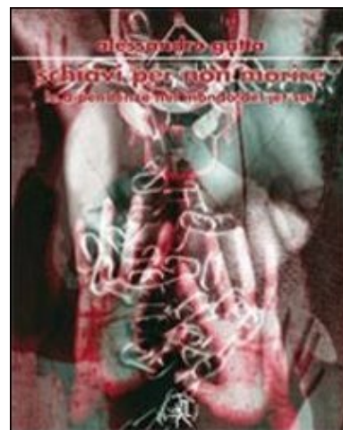
"Schiavi per non morire"

spingendosi oltre i limiti dell'esplorazione umana, come nel suo ultimo libro "Schiavi per non morire- le dipendenze nel mondo del jet-set" .